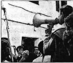
El spot ha levantado inusitado interés.

Las motos volverán a adueñarse de las carreteras de Menorca a lo largo de todo el fin de semana. Esta mañana recalán en Ciutadella los vehículos participantes en la segunda edición del Desembarco Harley Davidson Mallorca en Menorca. El evento se ha organizado con motivo de la conmemoración del primer aniversario de la creación del chapter menorquín, la asociación oficial que agrupa a los propietarios de este espectacular tipo de motos.