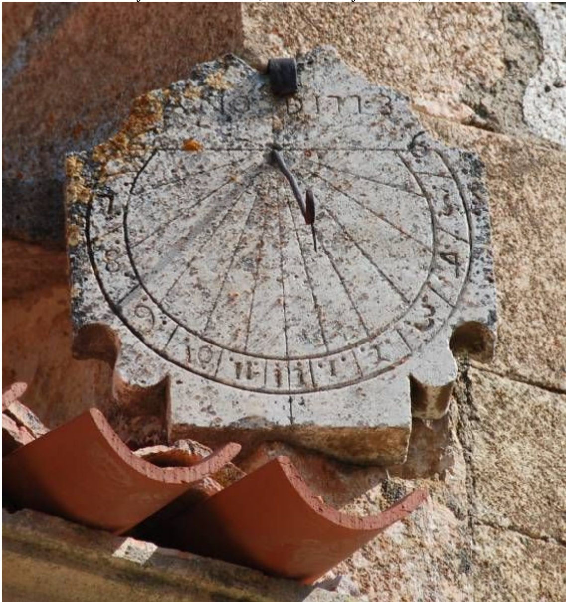
Circular. Vertical a mediodía orientado. Año de 1773.