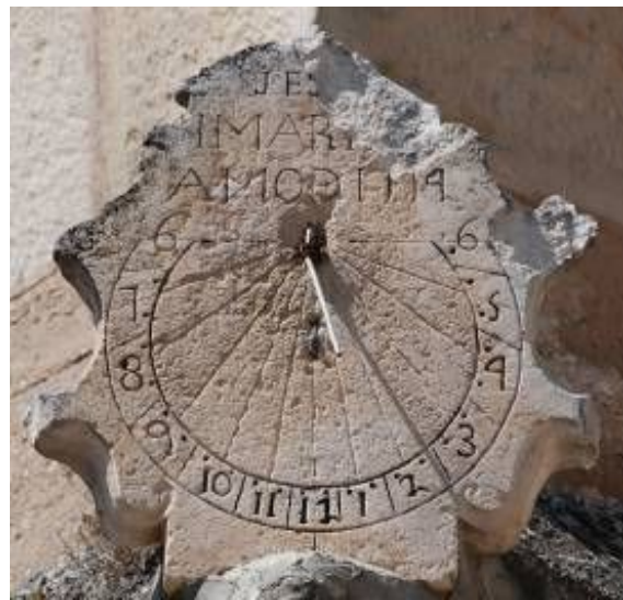
Gallejones de Zamanzas, 1774. Tubilleja de Ebro, 1774.