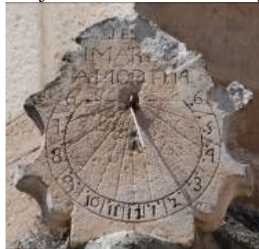
Tubilleja de Ebro, 1774.