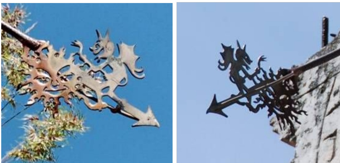
Reloj 3. Detalle. Extremo de la varilla. Diablo, sol y punta de flecha.

- Varilla: Cristo y diablo, luz y tinieblas, bien y mal