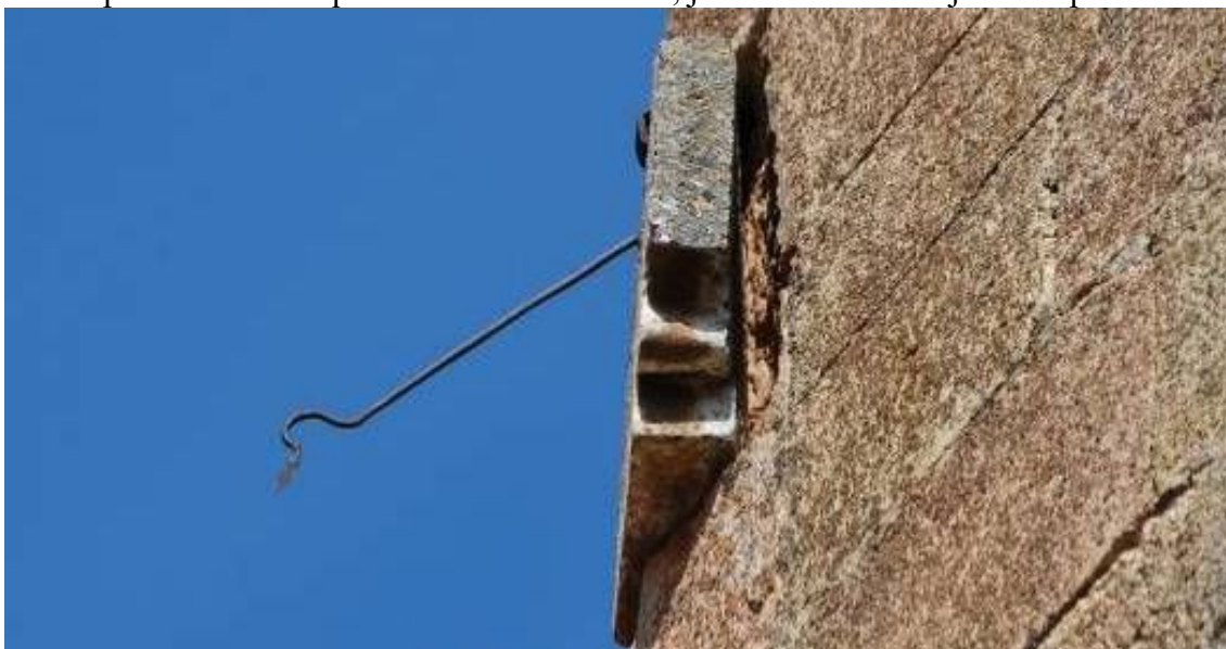
Varilla de apoyo único terminada en curva y punta de flecha.

Posiblemente la curva que vemos en el extremo de la varilla sirvió para colocar un herraje decorativo semejante al del diablo y el sol del reloj de la iglesia de Gallejones de Zamanzas.