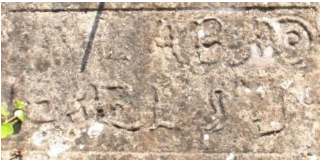
SUESA (Cantabria). "ALABADO SEA EL SS M S A ", Año 1717.

CARANCEJA (Cantabria). "VIVA JESÚS SACRAMENTADO", s/f