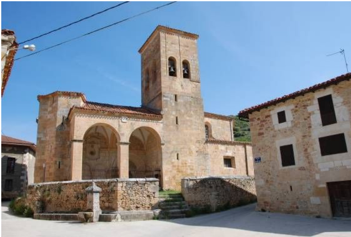
Empotrado en la esquina suroeste de la torre, justo encima del tejado del pórtico.

Autor: maestro cantero de Ahedo del Butrón.