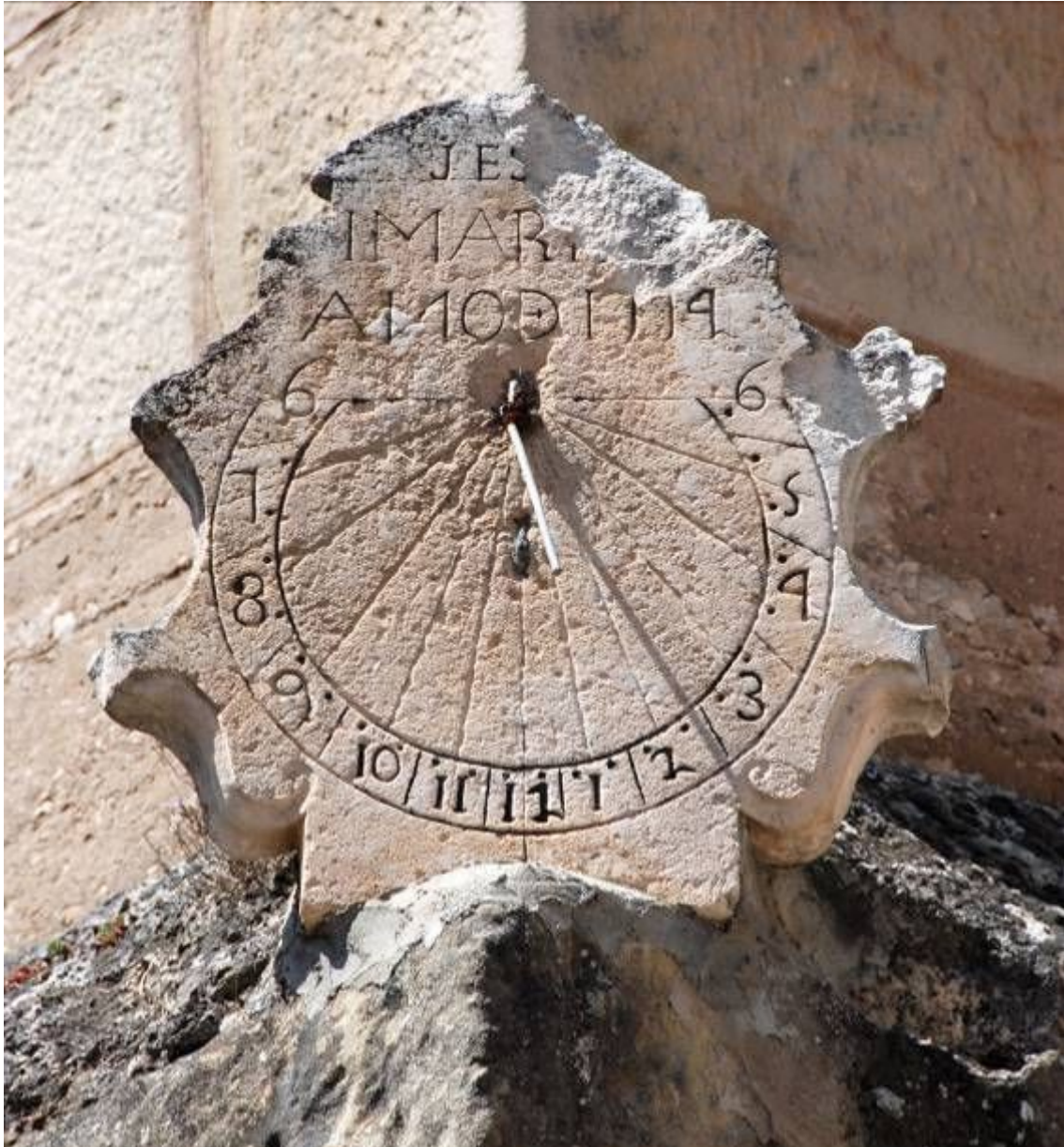
Circular. Vertical a mediodía orientado.

Está grabado en una placa de piedra arenisca de base recta y bordes recortados de dibujo más complicado que la del reloj de la iglesia del cercano pueblo de Ahedo del Butrón, obra del mismo artífice, construido en 1773. El borde superior de la placa ha sufrido desperfectos debido a la erosión o a algún desprendimiento. La zona ancha de la placa de piedra la ocupa el reloj de sol, en la parte superior lleva grabadas la leyenda JESÚS I MARÍA y la fecha, AÑO 1774.