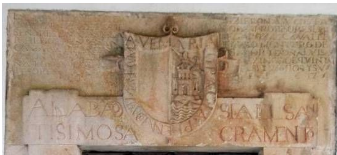
Quintana de los Prados. Capilla de los BEGA AZCONA.

La oración se repite en otros dos pueblos del norte de Burgos: Población de Arriba y Quintana de los Prados.