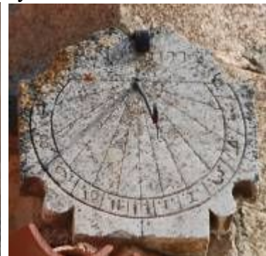
Ahedo del Butrón, 1773.

No llega a 14 kilómetros la distancia entre Ahedo del Butrón y Gallejones de Zamanzas pasando por Tubilleja de Ebro.