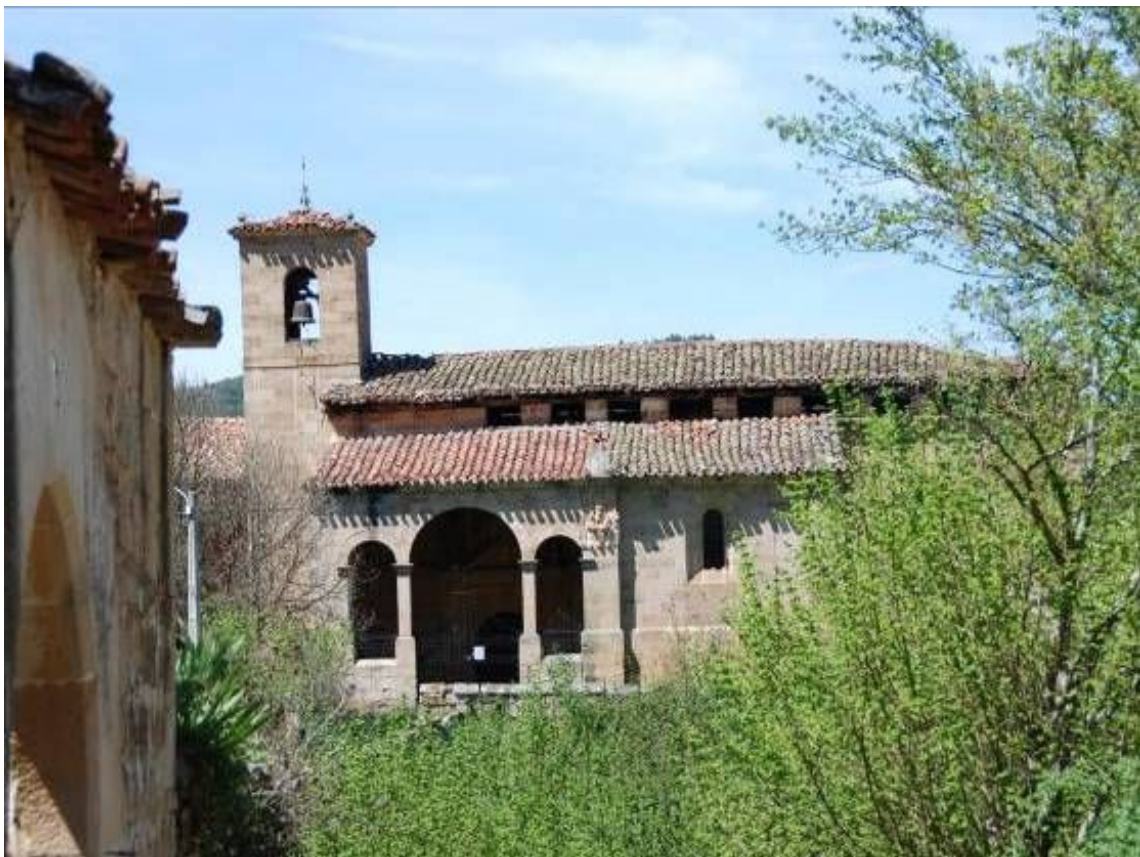
Reloj de sol situado en la esquina suroeste del tejado de la capilla de los Gallo.

Iglesia del siglo XVI de una sola nave con la capilla señorial de los Gallo y la sacristía, abiertas al muro sur, cabecera recta, torre cuadrangular a los pies y pórtico de tres arcos.