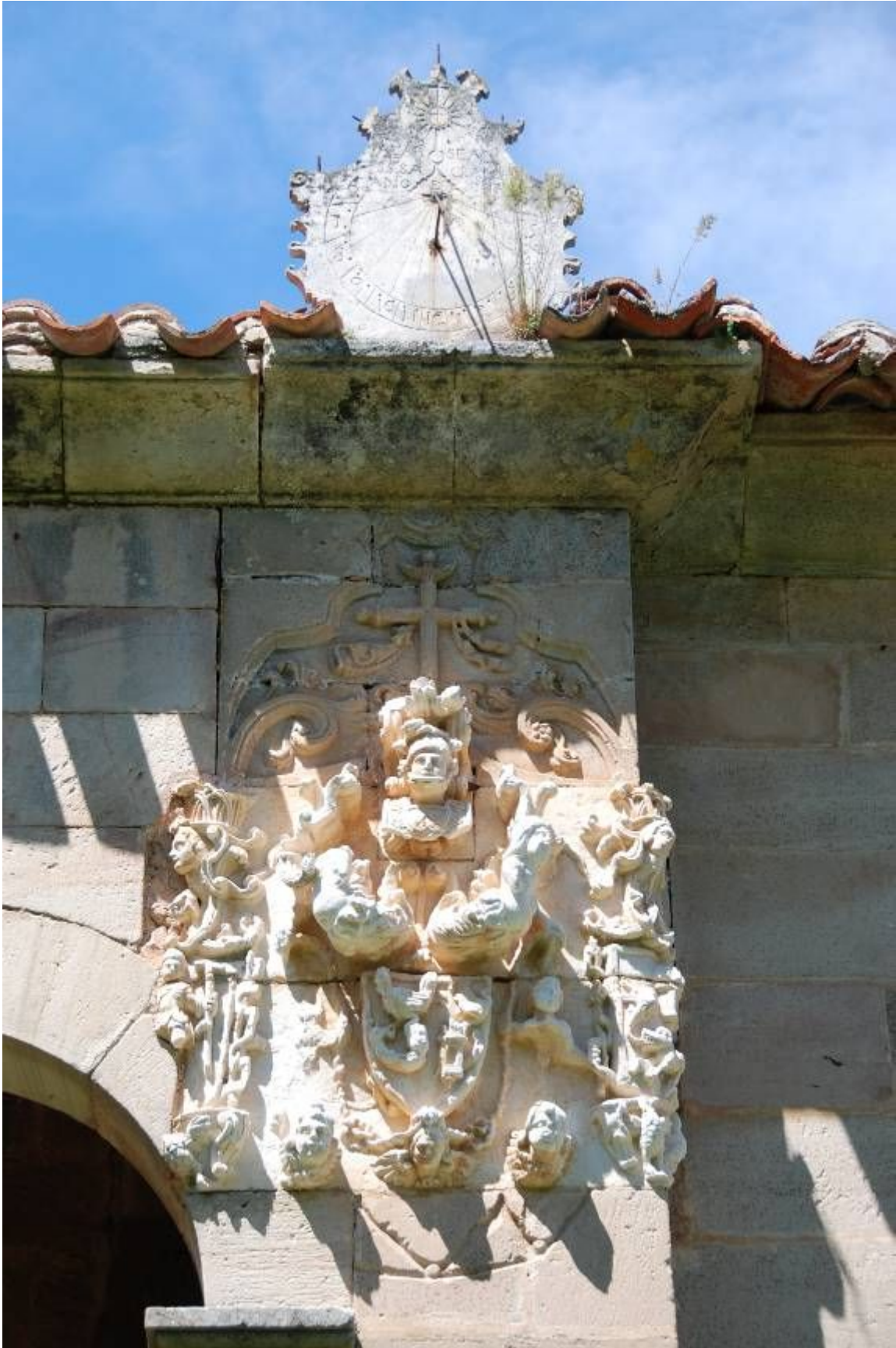
Pilastra izquierda de la capilla. Armas de los Gallo. El reloj de sol sobre la cornisa.