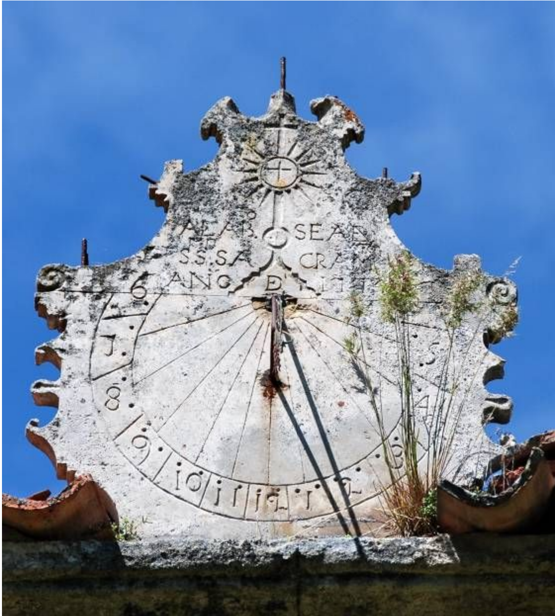
Circular. Vertical a mediodía orientado.

Está grabado en una placa de piedra de bordes recortados que recuerdan la silueta de un escudo. En la parte superior ha perdido varios apliques ornamentales de los que tan solo quedan los vástagos de sujeción. La zona ancha inferior de la placa de piedra la ocupa el reloj de sol, en la parte superior lleva grabada en hueco una custodia y una oración - ALABADO SEA EL SANTISIMO SACRAMENTO- , ambas alusivas a la adoración eucarística, y la fecha: AÑO 1774.