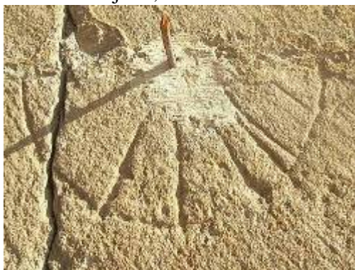
Villaseca, La Rioja.