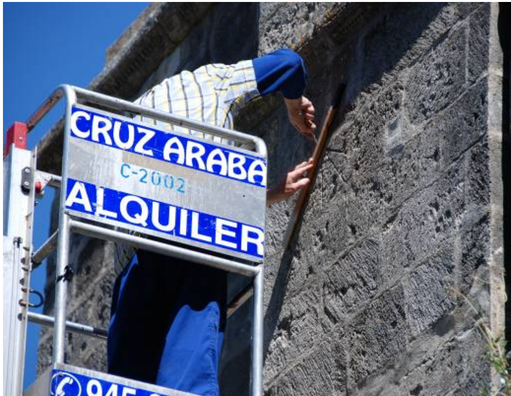
Limpieza de las líneas horarias con regla y puntero.