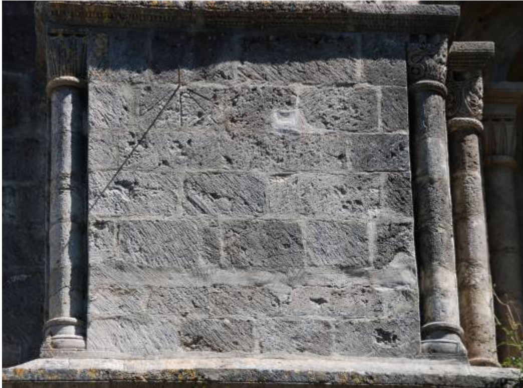
Fotografía tomada a las 11 horas y 57 minutos.