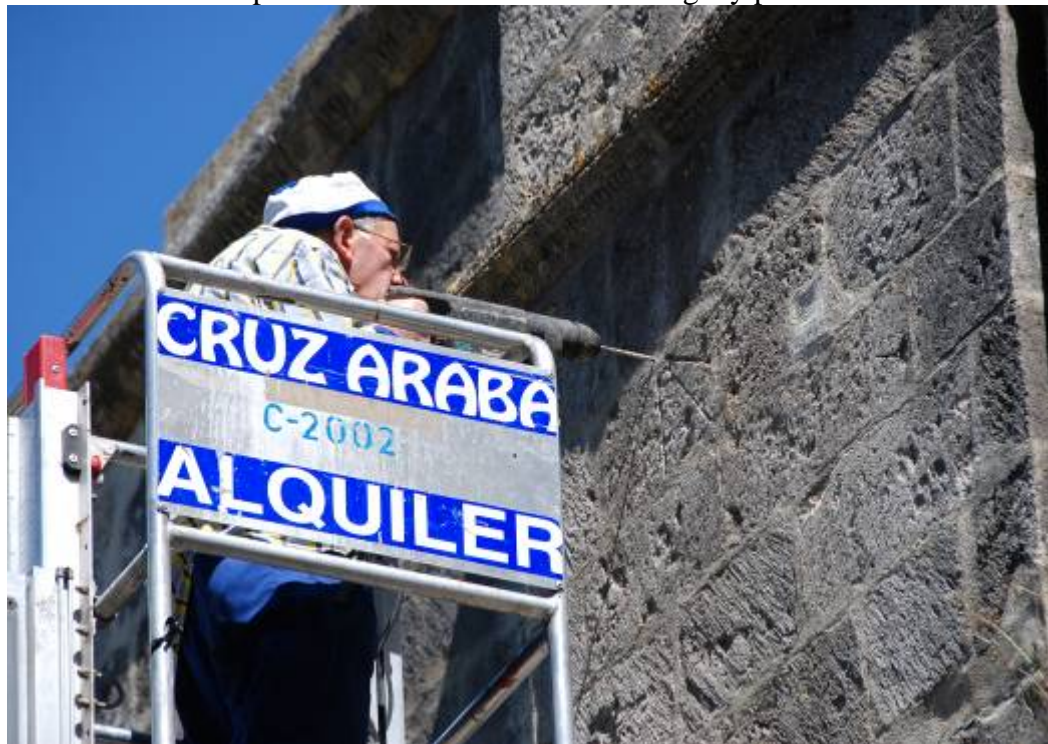
Taladrando el orificio de la varilla en la junta tapada con cemento.