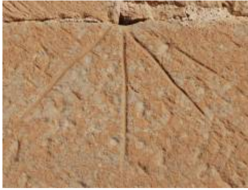
Torres del Río, Navarra.