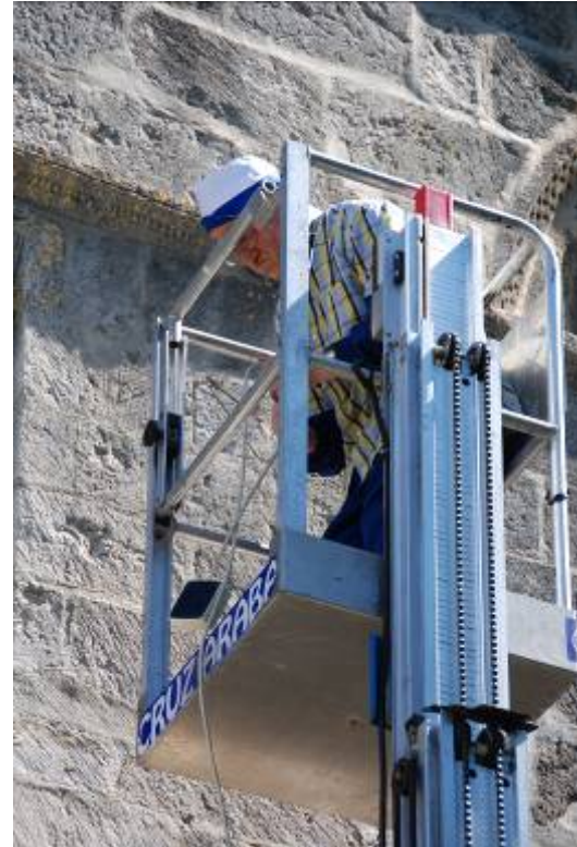
Los visitantes observan los preparativos para colocar la varilla.