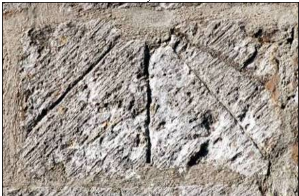
Reloj radial de 4 líneas en junta de sillar. Línea de Nona doble. Año 2006.

A la izquierda del ventanal del segundo cuerpo se encuentra el reloj. Ocupa la traza un sillarejo rectangular entero. Tiene cuatro líneas; una de ellas, la de trazo más profundo, pudo ser añadida con posterioridad. Dicen Las Partidas que en festividades señaladas la misa de Nona se adelantaba. En la restauración taparon el agujero de la varilla.