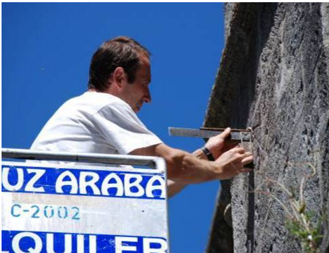
Reposición de la varilla (22 cm) del reloj canónico. Lanean. Eskuaira eta guzti!