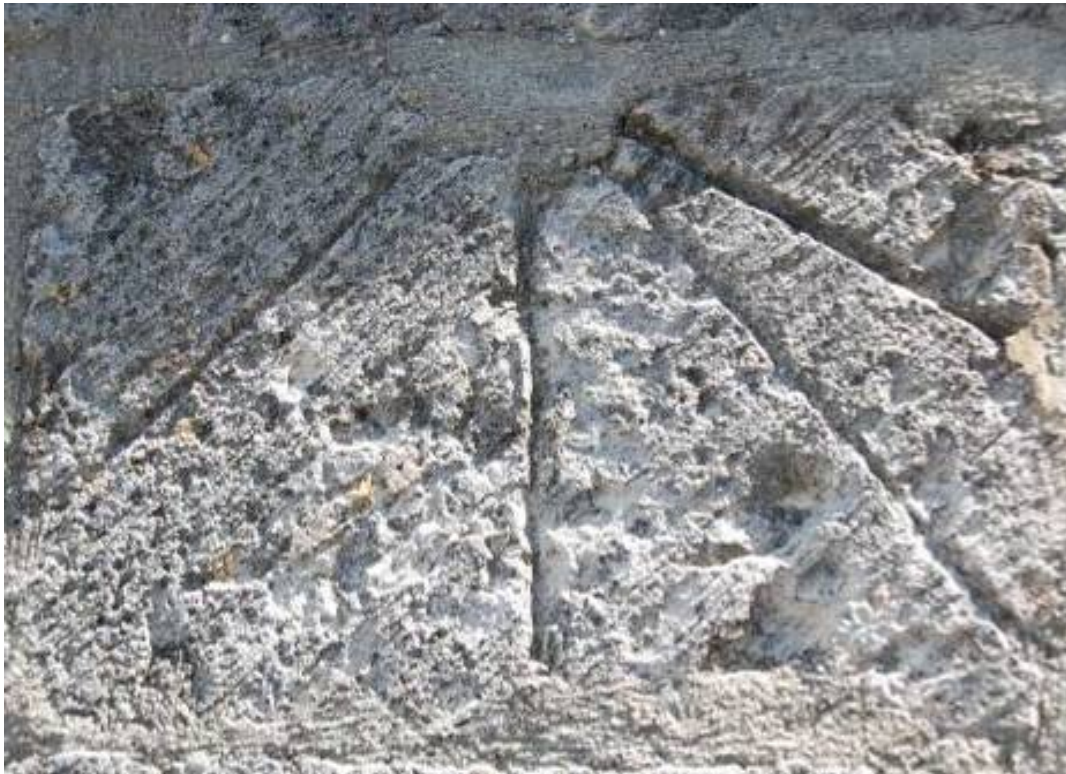
El sillar del reloj desde la plataforma. Línea doble de Nona. Mide 53x22 cm.