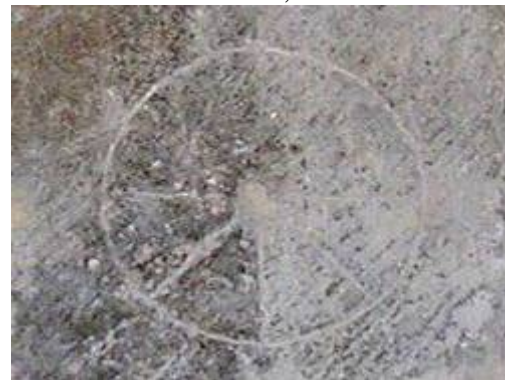
San Zadornil, Burgos.

Ejemplos de relojes canónicos con doble línea de Nona. Más información en el Inventario de relojes de sol de la Diócesis de Vitoria-Gasteiz , Relojes canónicos con numeración e Inventario de relojes canónicos .