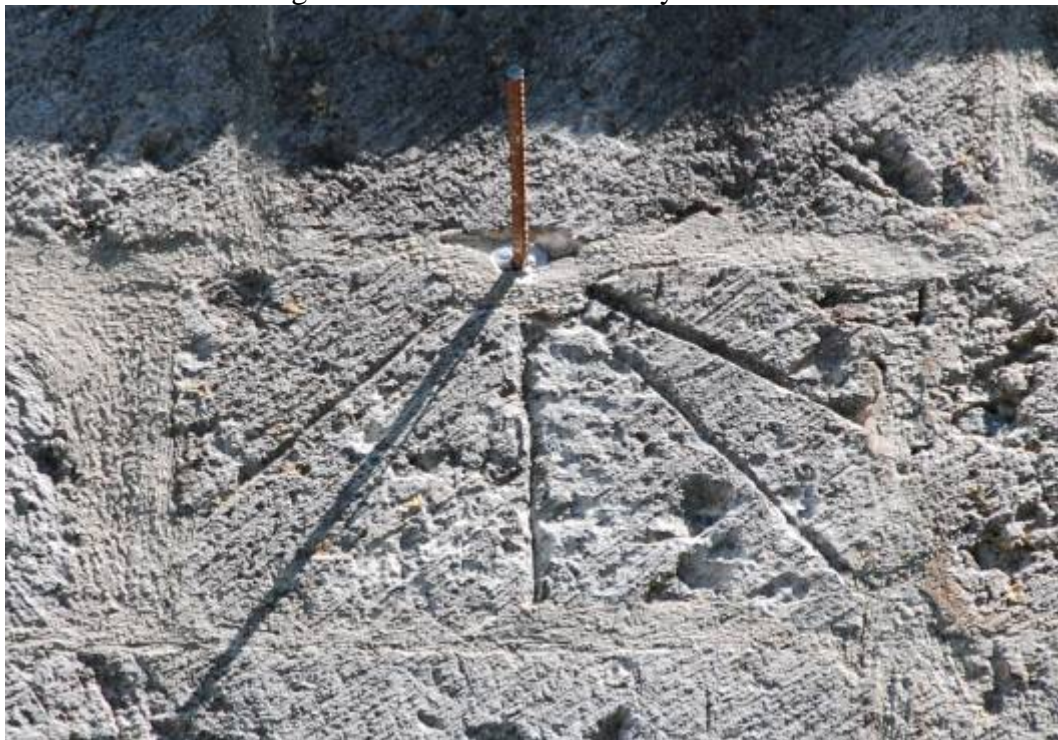
La sombra de la varilla entre la Tercia y la Sexta.