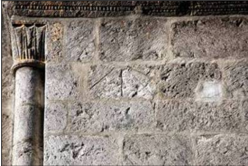
El sillar del reloj de sol canónico.