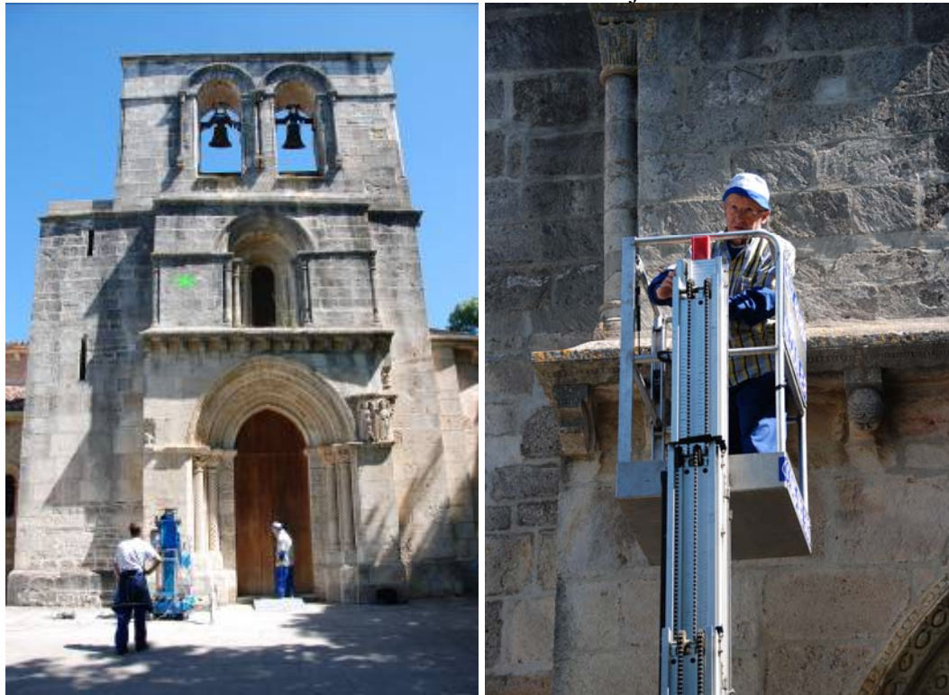
El superior del monasterio de Estíbaliz encaramado en la plataforma elevadora.