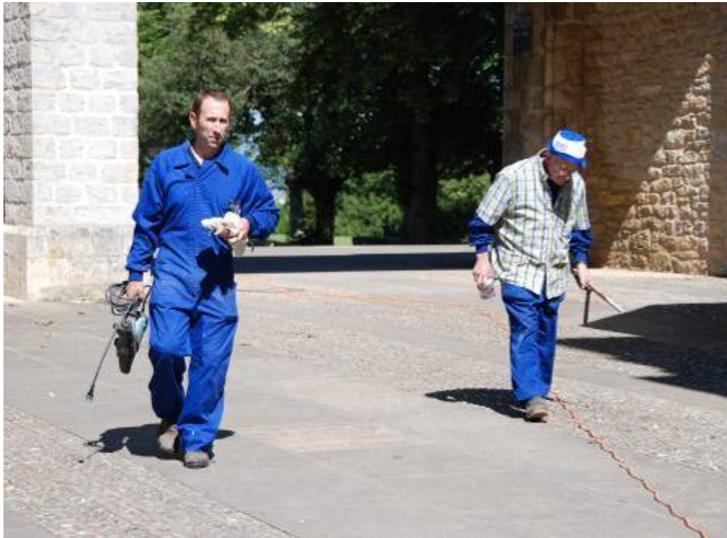
Ora et labora. Los benedictinos en traje de faena.

Reposición de la varilla del reloj canónico de Estíbaliz.